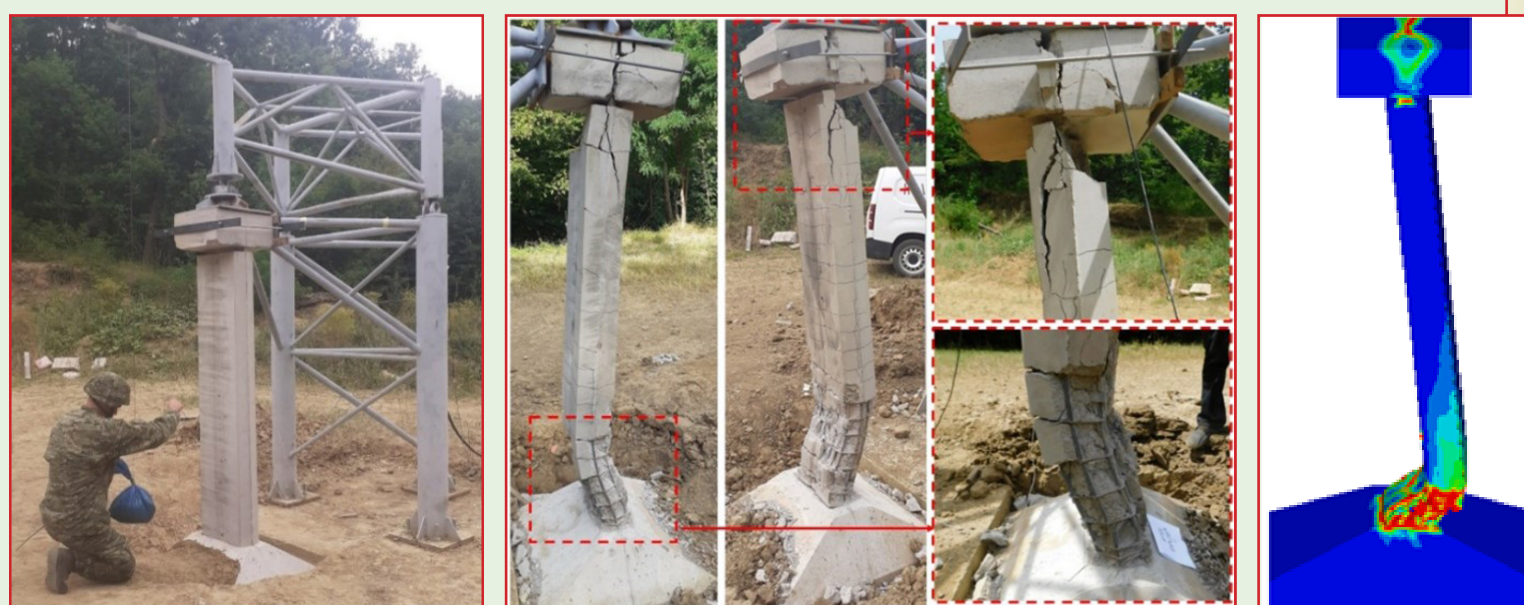
Slika 3. Postav za 3. dio eksperimenta (lijevo), oštećenje stupa (sredina), numerički model (desno)

Prometna infrastruktura postaje vrlo zanimljiv cilj napada eksplozivnim napravama s obzirom da oštećivanje i uništavanje određenih prometnih dionica ili konstrukcija, kao što su mostovi, može prouzročiti poteškoće u prometu i odsijecanje strateških točaka. Glavni cilj istraživanja je odrediti kapacitete na eksplozivna djelovanja za izgrađene mostove hrvatskih autocesta kroz određivanje najčešće korištenog tipa stupa mosta te štetu prouzročenu primjenom detonacija paketa određene količine eksploziva postavljenih u automobilu smještenom ispod mosta. Eksperimentalna istraživanja se provode u suradnji s policijskim odredom za eksplozive i Hrvatskom vojskom koji osiguravaju eksploziv i stručno osoblje na vojnom poligonu. Eksperimentalni program istraživanja podijeljen je na tri dijela: