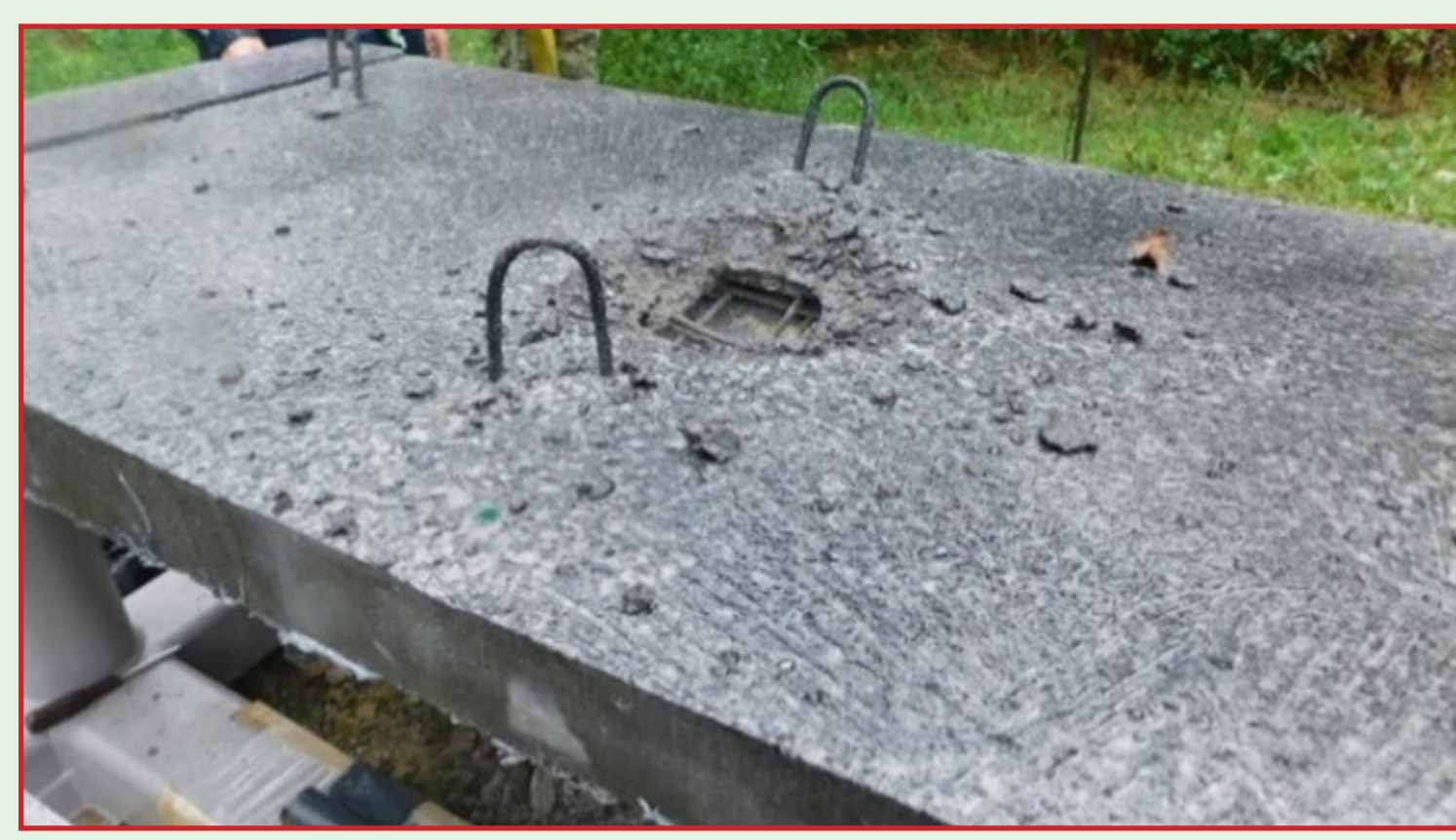
Slika 2. Postav instrumenata za 2. dio eksperimenta (lijevo), oštećenja ploče (desno).